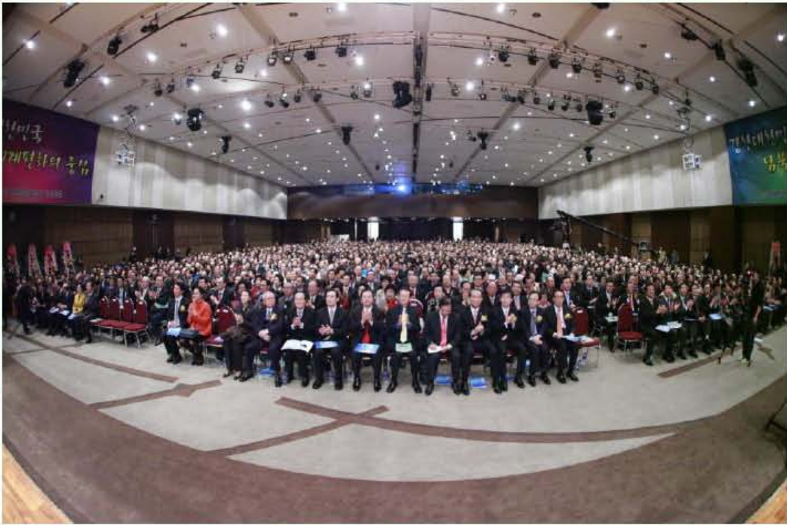
2,380 participants filled the venue