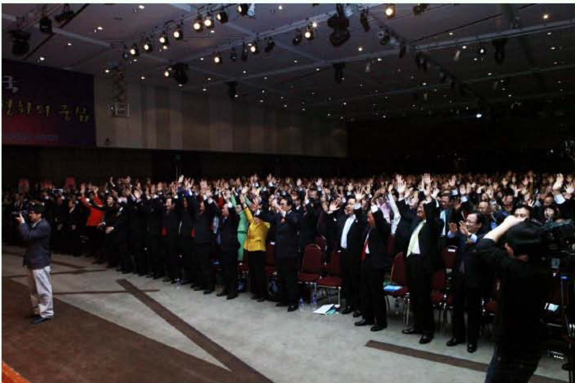
The guests offering three cheers of Og-Mansei

Launch Rally for National Campaign Headquarters for a Strong Korea turned out to be a great success. From this day forward, we hope that Korea will re-unify peacefully, find the solution for North-East Asia's true peace and prosperity and assume the central role in attaining peace and prosperity. We ask for your continued love and support.