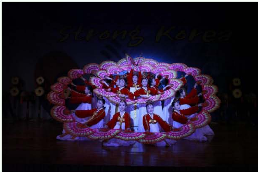
Part 1: Cultural Performance - Little Angels