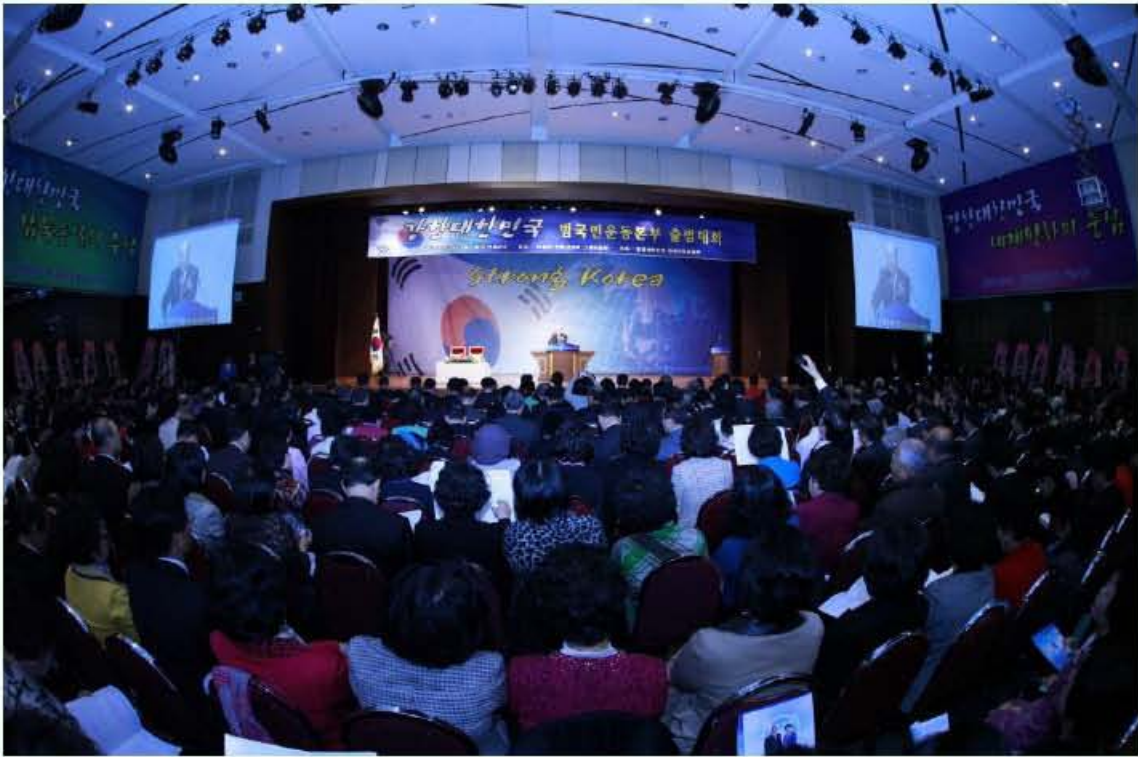
A scene from the event