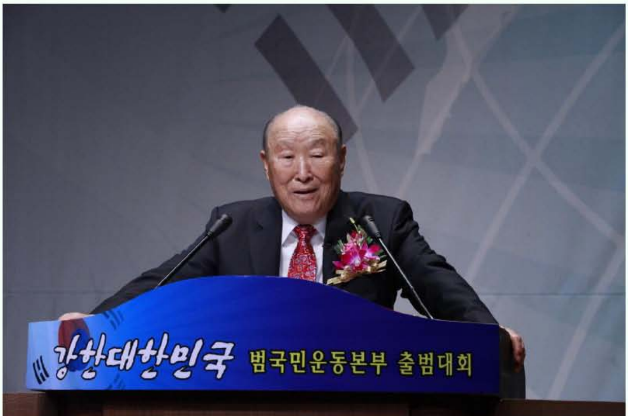
True Father (Rev. Sun Myung Moon) speaking to the audience